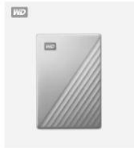
My Passport Ultra